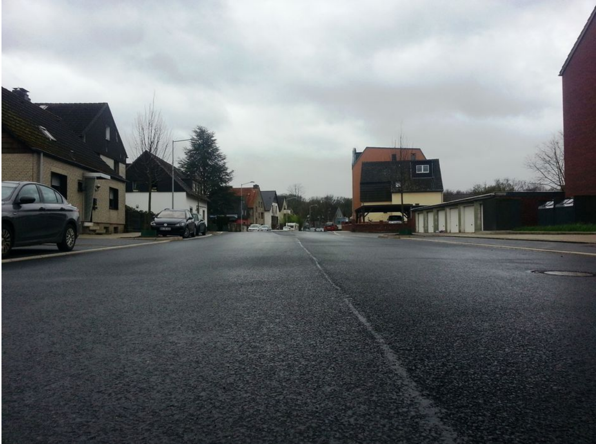
Schaubild 2: Befahrbare Piste: Foto BoKlima, aufgenommen nach Fertigstellung (Feb 2022)

die Einsparung von stofflichen wie finanziellen Ressourcen wären der Gewinn für unsere Stadt und für die Anwohner gewesen.