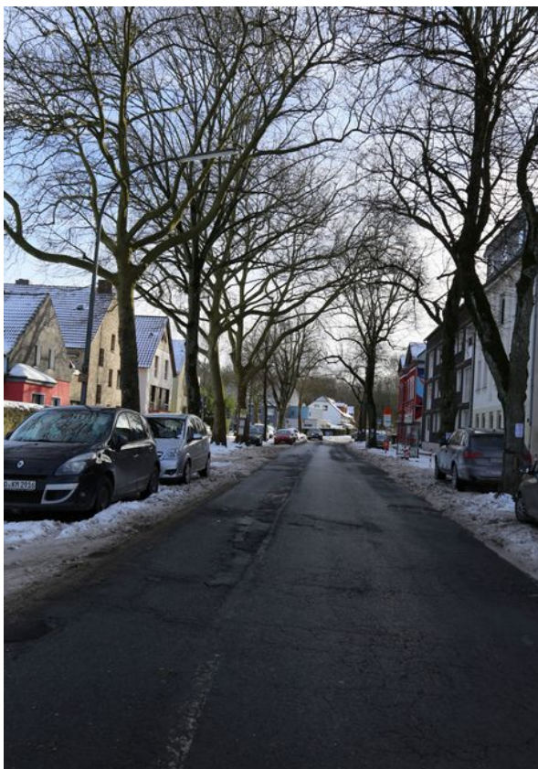
Schaubild 1: Bewohnbare Straße: aufgenommen einen Tag vor der Abholzung aller Bäume (Feb 2021)

Dieser Abschnitt der Blankensteiner Straße in Bochum Weitmar litt unter einem schlechten Straßenbelag und glänzte durch einen wunderbaren Baumbestand (erstes Foto).