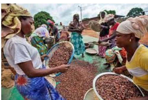
Schaubild 5:

bedauerlich (Bild oben). Wir möchten der Fa. Ecofina deshalb an dieser Stelle vorschlagen, doch einmal ernsthaft zu prüfen, ob sie ihre Beschaffung nicht künftig, ganz im Geiste unserer Stadt, ebenfalls auf FairTrade umstellen könnte. Für die angesprochene Zielgruppe des Schokoladenherstellers sollte dies vermutlich finanzierbar sein.