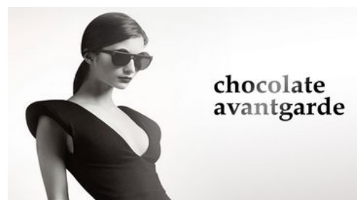
Schaubild 4:

Dass Bochum sich um faire Beschaffung und fairen Handel bemüht und vor einem Jahr erneut eine entsprechende Zertifizierung erhielt, ist eine gute Sache. Dass der in der Neustraße künftig angesiedelte Schokoladenanbieter auf andere Verkaufsargumente als FairTrade setzt, ist dagegen